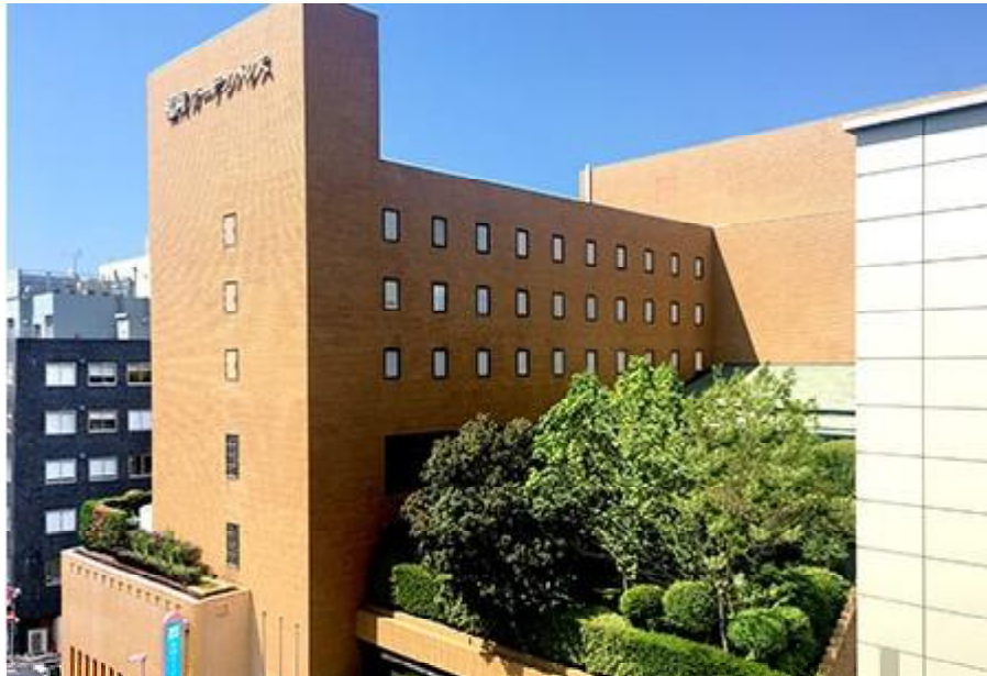
福岡空港からのアクセス

〒810-0001 福岡県福岡市中央区天神4-8-15 TEL : 092-713-1112 地下鉄天神駅徒歩 8 分