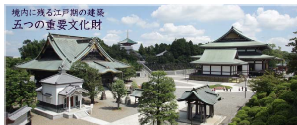
境内に残る江戸期の建築 五つの重要文化財

千葉県成田市成田1番地 TEL 0476-22-2111 成田山の境内には、重要文化財に指定された5つの建築物があります。その内、最も古い光明堂は1701（元禄14）年建立、成田山が初の江戸出開帳を行った時期です。次に古い三重塔が1712（正徳2）年建立、そして続く仁王門は、1830（文政13）年に建立されました。見事な五百羅漢像の彫刻が素晴らしい前本堂の釈迦堂は、1858（安政5）年に建立、奉納額や絵馬を掲げる額堂は1861（文久元）年坂本龍馬が活躍する幕末の頃に建立されました。