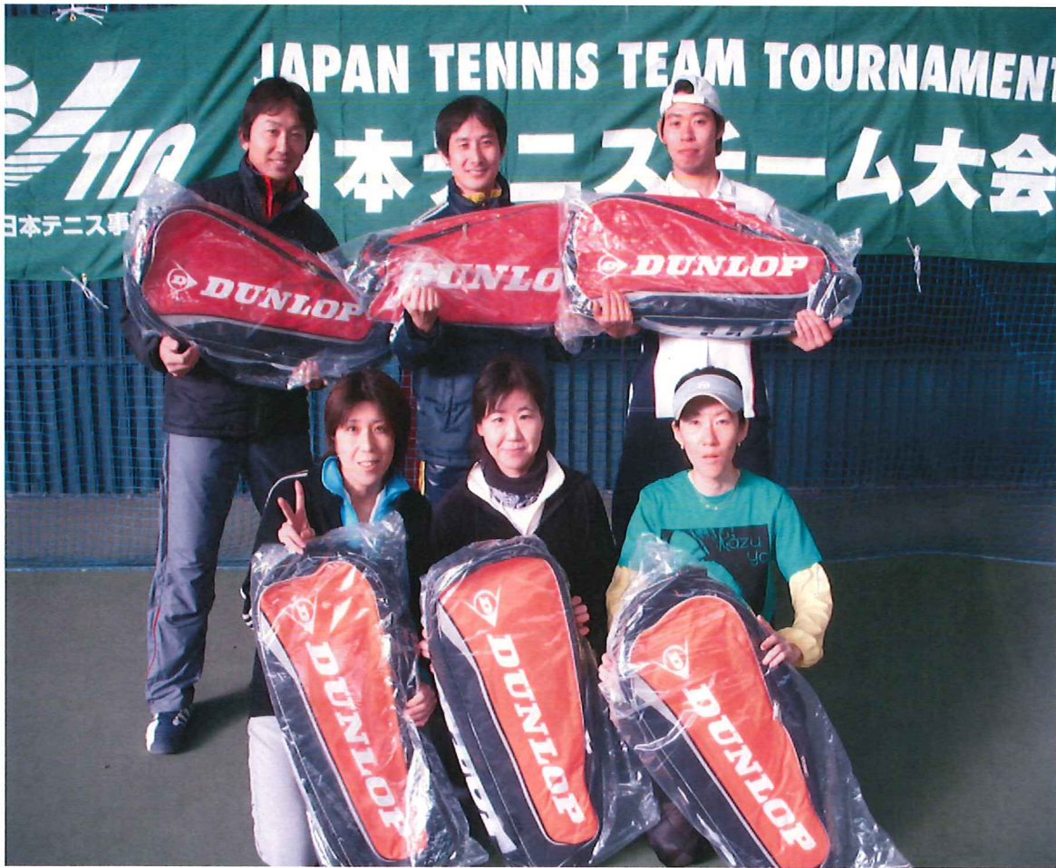
優勝:江坂テニスセンターAチーム